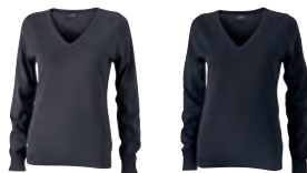
anthracite melange black