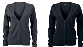
anthracite melange black