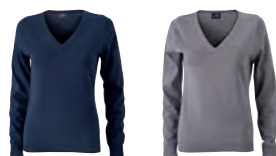
navy grey heather