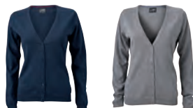
navy grey heather