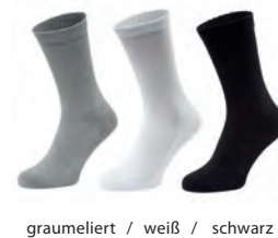
graumeliert / weiß / schwarz