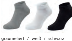
graumeliert / weiß / schwarz